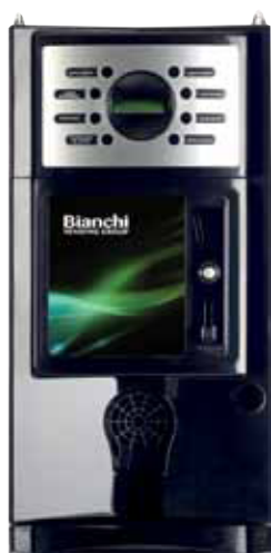
GAIA COM PAINEL FRONTAL DE INTRODUÇÃO DE MOEDAS