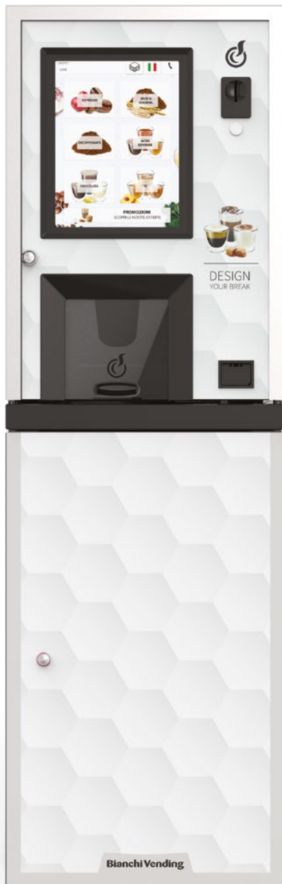
LEI250 TOUCH15" + MÓVEL + KIT ADESIVO COM GRAFISMO "DESIGN YOUR BREAK" (OPCIONAL)