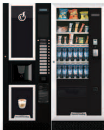
LEI400 + ARIA M MASTER