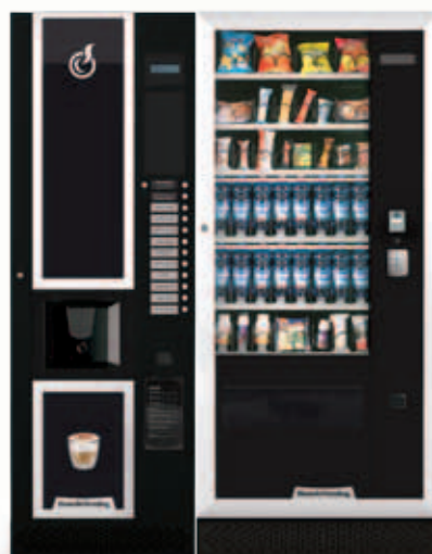
LEI600 + ARIA L MASTER